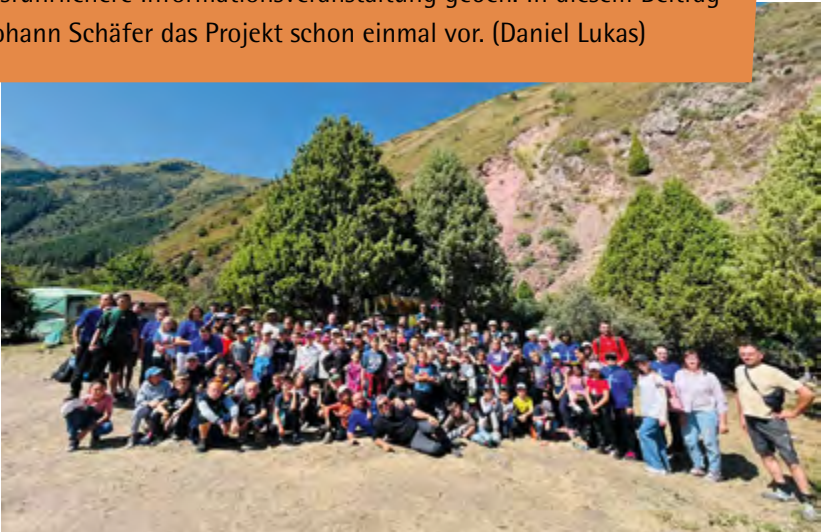
Sommercamp mit Kindern