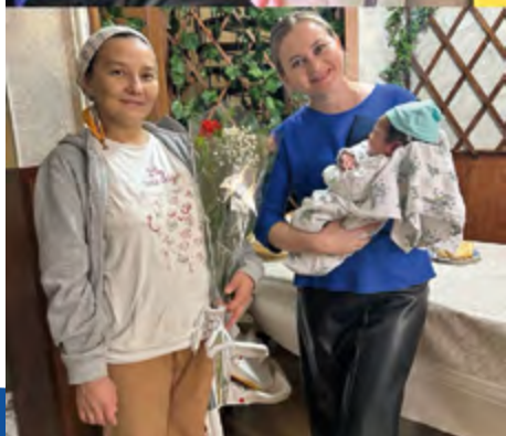
Frauenarbeit mit jungen Müttern

Lebenssituationen, geprägt von Armut, Verantwortung für die Familie und oft fehlenden Perspektiven. Durch Schulungen, Gemeinschaft und seelsorgerliche Begleitung erfahren sie neue Hoffnung und entdecken ihren eigenen Wert. Kinder erhalten einen geschützten Raum, in dem sie einfach Kind sein dürfen.