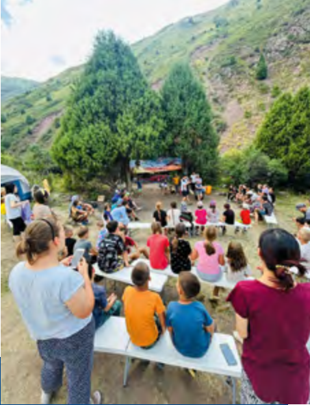
Gottesdienst im Kindersommerncamp