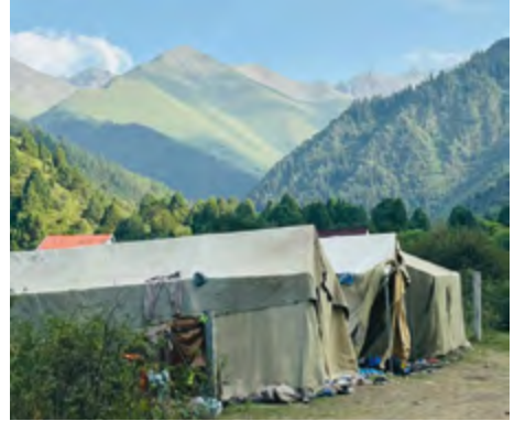
Zelte im Sommerncamp

möglich sein. Kinder sollen erleben, dass sie willkommen sind, dass sie geliebt werden, dass ihr Leben wertvoll ist und dass Gott sie liebt. Sie sollen Freude erfahren, Freundschaften schließen und einen Ort haben, an dem sie zur Ruhe kommen können. Hier kann ihnen Gottes Wort und Liebe auf kindgerechte Weise nahegebracht werden. Die Vision bleibt dabei klar: Menschen zu dienen, Kinder zu stärken und einen Raum zu schaffen, in dem Liebe, Freude und Glaube erfahrbar werden. Kirgisistan ist dabei nicht nur ein Einsatzort, sondern ein Ort, an dem Herzen berührt und Leben verändert werden – Schritt für Schritt, Kind für Kind. ▼