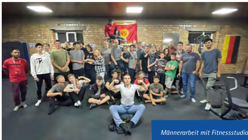
Männerarbeit mit Fitnessstudio

Ein bedeutender Meilenstein ist der Erwerb eines eigenen Grundstücks. In den Sommermonaten werden dort Sommercamps